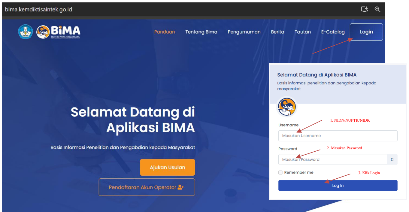
Gambar 1. Beranda akses memasuki aplikasi BIMA

Penerima pendanaan penelitian dan pengabdian kepada masyarakat di Perguruan Tinggi Tahun Anggaran 2025 wajib melakukan revisi proposal, rencana anggaran biaya (RAB), dan mengunggah surat pernyataan kesanggupan pelaksanaan melalui aplikasi BIMA pada laman https://bima.kemdiktisaintek.go.id/ dengan menggunakan akun ketua pengusul masing-masing, sebagaimana diperlihatkan pada Gambar 1.